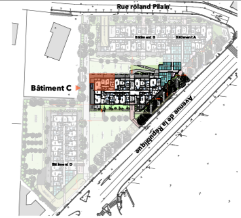
PLAN DE REPERAGE - SANS ECHELLE