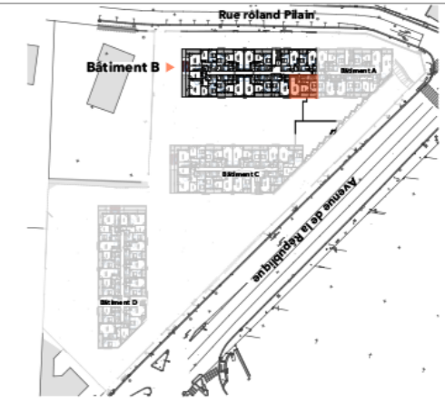
PLAN DE REPERAGE - SANS ECHELLE