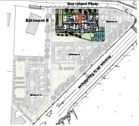
PLAN DE REPERAGE - SANS ECHELLE